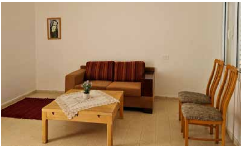
אחד מהחדרים ששופצו באהבה לחיילים הבודדים.

8. סוף סוף פרויקט ארוך טווח: קליטת חיילים בודדים חסרי עורף משפחתי. בשיתוף פעולה הדוק עם התנועה הקיבוצית שופצו 4 חדרים כולל בניית פרגולות ומחסן שבו מכונות כביסה ומייבש. כל החדרים נוקו ואובזרו בעיקר מתרומות ציוד של רבים וטובים. 4 חיילים כבר כאן. משפחות מלוות הותאמו לחיילים המעוניינים בכך ובליווי צמוד של נאווה ופטו אנו עושים צעדים ראשונים בפרוייקט זה. זה מה שהספקנו בשנה האחרונה. התכניות לעתיד רבות.